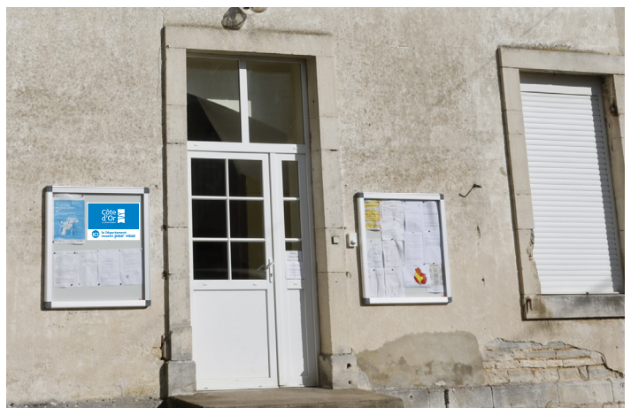
exemple de mise en situation

Gabarit à télécharger sur le site Internet cotedor.fr (impression à la charge du bénéficiaire)