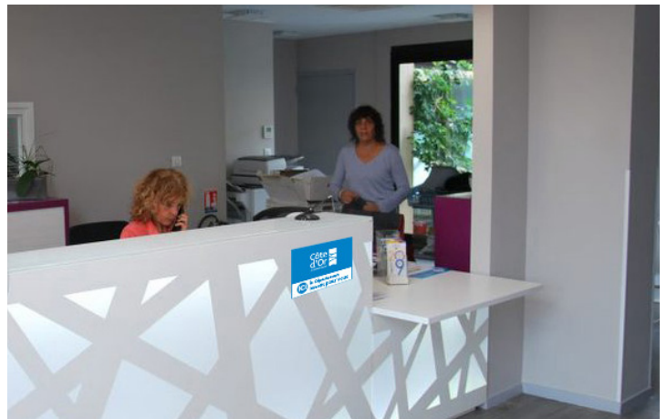
exemple de mise en situation