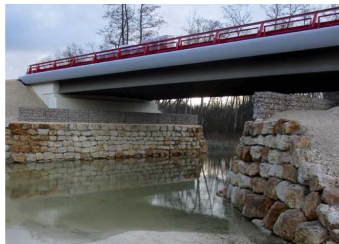
8. Ouvrage de transparence hydraulique pour 878 000 €