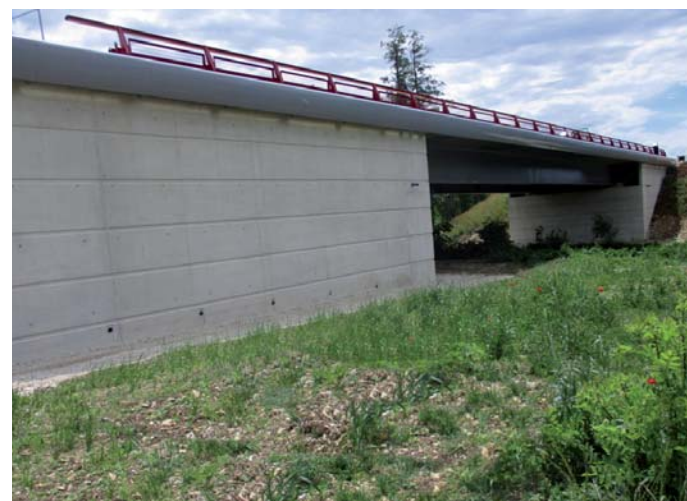
12. Ouvrage d'art sur « la Bèze » pour 2,2 M€