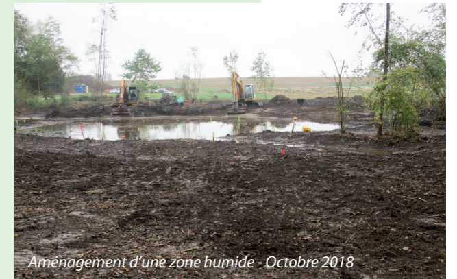
Aménagement d'une zone humide - Octobre 2018