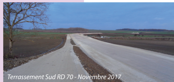
Terrassement Sud RD 70 - Novembre 2017