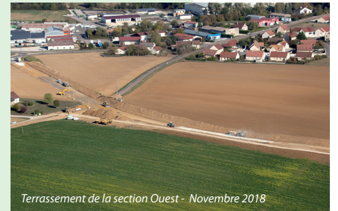
Terrassement de la section Ouest - Novembre 2018