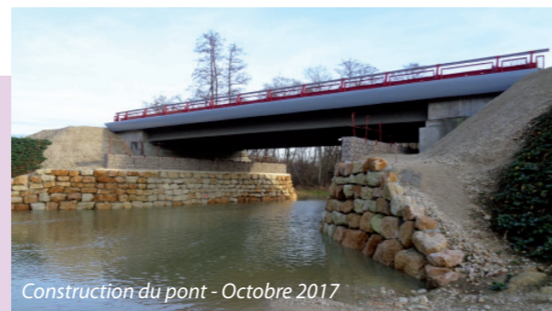
Construction du pont - Octobre 2017