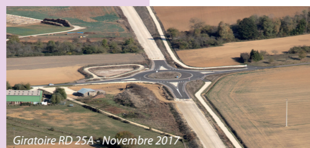
Giratoire RD 25A - Novembre 2017