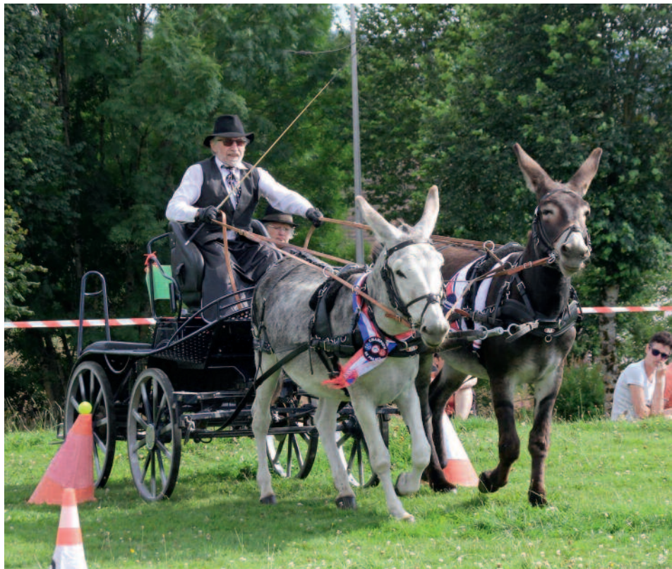
"Fais pas l'âne !" - Chaignay