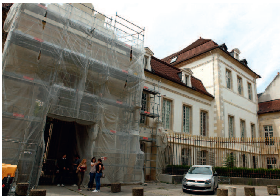
La façade historique de Marcelle Pardé en cours de rénovation

À Camille Claudel (Chevigny-Saint-Sauveur), après le remplacement des menuiseries extérieures et des volets roulants, c’est l’ascenseur du bâtiment B qui sera changé au cours du dernier trimestre de 2017. Du côté du collège dijonnais Marcelle Pardé, la rénovation des façades sur rue et des menuiseries extérieures de plusieurs bâtiments se poursuivra jusqu’à décembre. Toujours à Dijon, un local poubelles a été construit cet été à Champollion, tandis que les travaux de réfection de l’étanchéité de la toiture-terrasse de l’atelier SEGPA sont en cours d’achèvement au collège Gaston Roupnel. Enfin, au collège Henri Dunant, la chaufferie sera rénovée courant septembre et le raccordement au réseau de chauffage urbain réalisé.