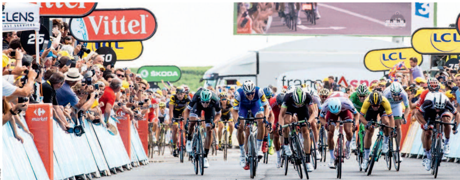
Marcel Kittel remporte l'étape et le maillot vert