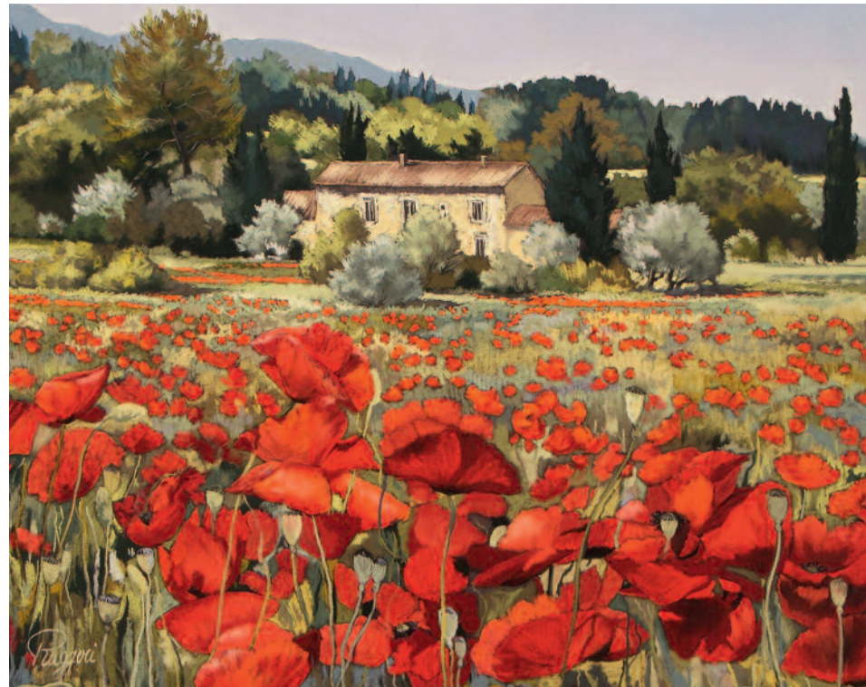
Pastel en Bourgogne - Gevrey-Chambertin