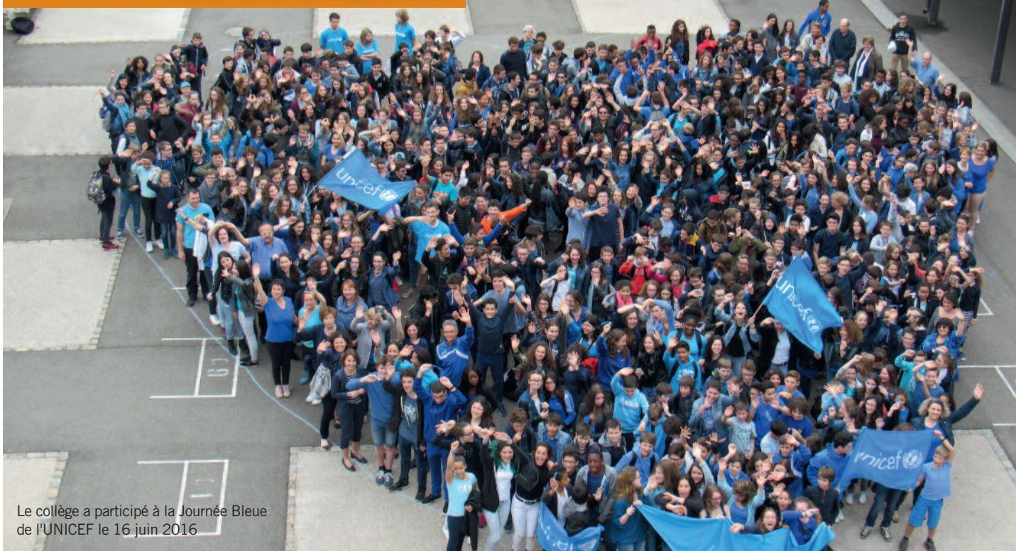
Le collège a participé à la Journée Bleue de l'UNICEF le 16 juin 2016