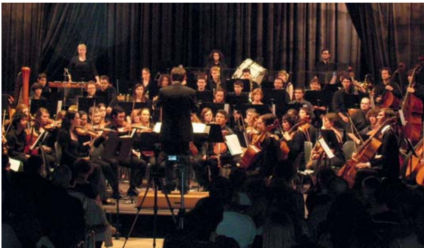
Schéma départemental des enseignements artistiques