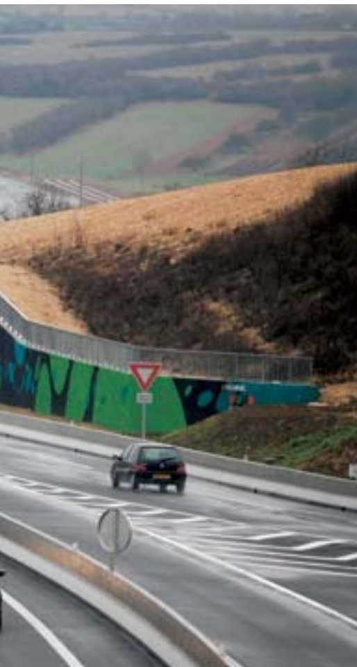
10 janvier 2014 : ouverture à la circulation de la LiNo