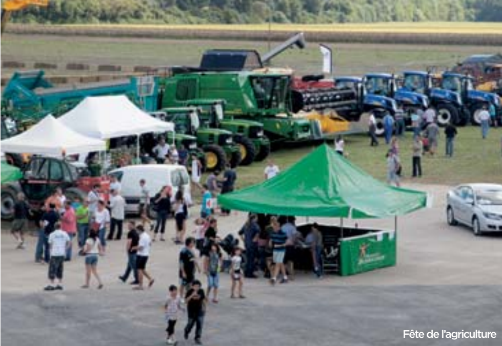
Fête de l'agriculture