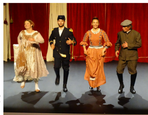
© Compagnie Le Rocher des Doms

Après L'Utopie des arbres , la compagnie Taxi-Brousse se penche sur le paradoxe de l'endive, cet instant irrésistible où l'adolescent, les pieds plantés dans le merdier de sa vie, cherche à faire pousser ses feuilles pour partir à l'assaut du monde.