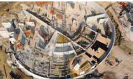
© Bruno Le Hir de Fallais

Début juillet 2009 : deux grues sont installées pour la réalisation du chantier. D'importantes pluies d'orage ont perturbé les travaux de terrassement et des opérations de pompage ont été nécessaires pour réaliser les fondations du bâtiment dans les meilleures conditions.