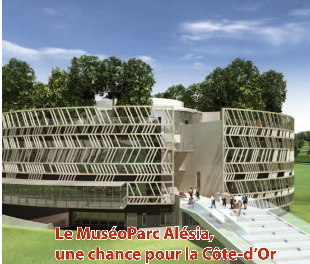
© B. Tschumi Architectes - Infographie Lecapentier

“Avant tout pour la qualité du projet ! Ensuite, il est certain que faire appel à un concepteur de cette renommée aura une influence sur la notoriété du MuséoParc et l'image de la Côte-d'Or. D'ailleurs, le MuséoParc Alésia a récemment été retenu par l'Etat dans le cadre de son “plan Musées en Régions” 2011-2013. Il sera, comme annoncé par le ministre de la Culture, soutenu pour son “ambition architecturale, un élément majeur du rayonnement des musées.”